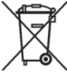
Symbol auf Elektro- und Elektronikgeräten